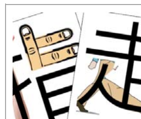
圖形文字, 幫忙記憶

小朋友在認字和閱讀方面較弱, 加上本身中文在字形上較為複雜, 難以掌握, 影響學習, 繼而出現寫字困難等問題。本校為學前的小朋友度身訂造一個學習中文認字課程, 目的是希望透過有趣圖畫將文字圖畫化, 再加動作, 提升小朋友對學習中文的興趣