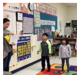
每堂均設有遊戲時間, 鞏固學習知識。